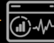
Tableau de bord personnalisé par organisme culturel Audiences d'un organisme